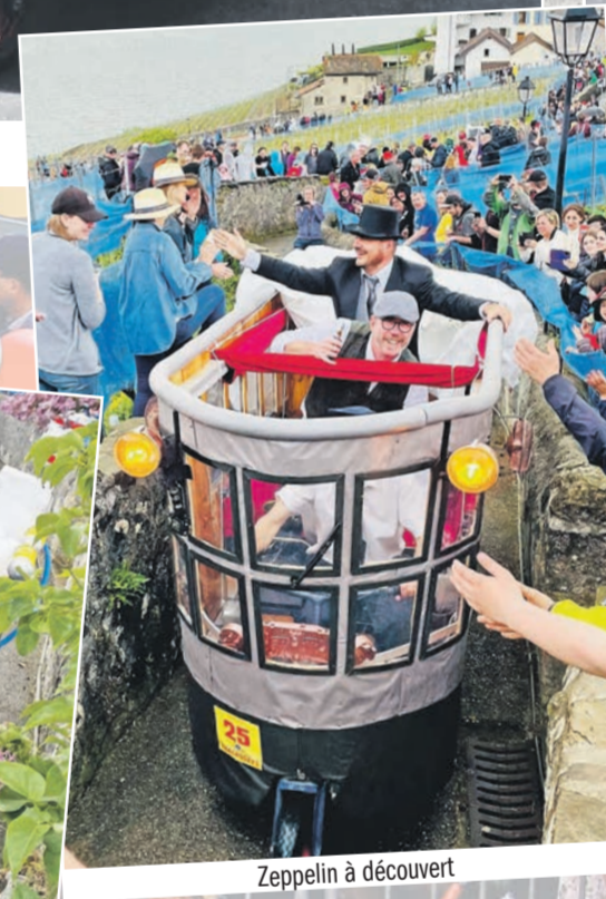
Zeppelin à découvert