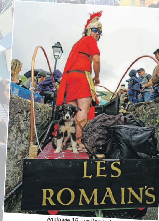
Équipage 15, Les Romains