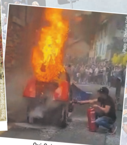
Oui-Oui prenant feu